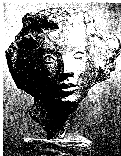
Máscara de bronze (Museu Nacional Soares dos Reis).

Ainda em Lisboa, na Escola Francisco Arruda, outra obra sua, a escultura de uma bailarina, existindo outra obra sua no Conservatório de Música do Porto. Também nos Edifícios Londres, na Senhora da Hora, seis painéis de azulejos sobre Paris e para os escritórios da Fábrica Milaneza, ao tempo sitos na Rua Cândido dos Reis, produziu uma cerâmica e um vidro gravado que actualmente se encontram nas instalações da Fábrica, em Parada, existindo na mesma um mosaico cujos motivos são referentes ao ci-