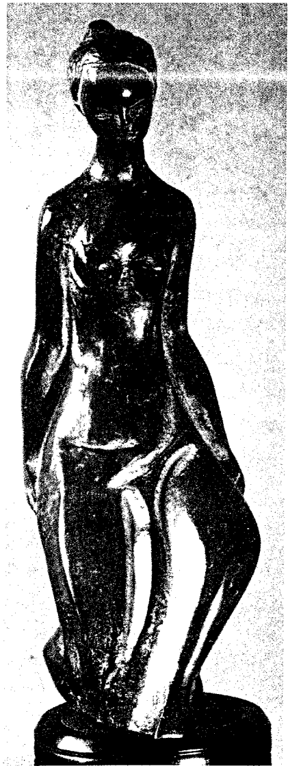
Rapariga em bronze.

Aqui fica o repto para que a realize a breve trecho ■