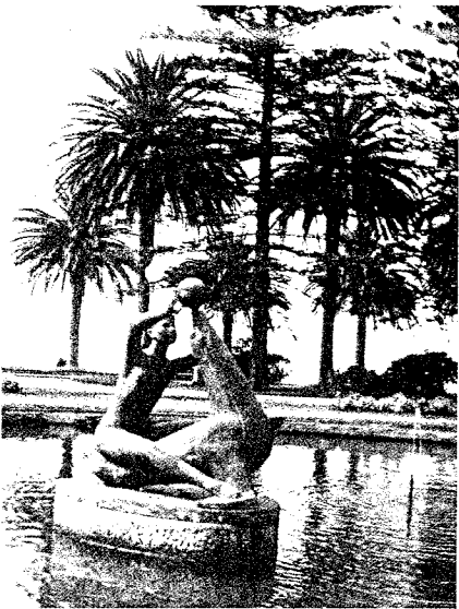
A Menina e a Foca, no Jardim do Passeio Alegre.

clo do pão, desde a cultura às farinhas. Em Guimarães, existe também num prédio uma escultura sua e outra em Paço de Arcos igualmente num edifício de habitação. Na Rua Augusta, em Lisboa, quatro painéis e uma cerâmica em prédios desta artéria da capital ilustram o talento do artista.