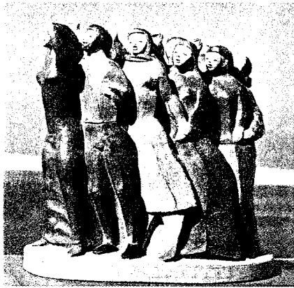
Liberdade (grupo escultórico alusivo ao 25 de Abril).