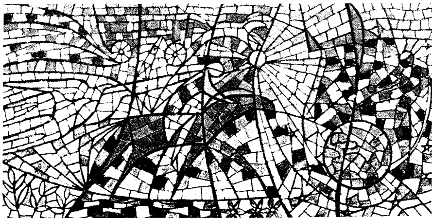
Vitral dos Correios de Guimarães.